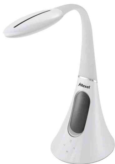
LED-Tischleuchte ActiVita Pod+